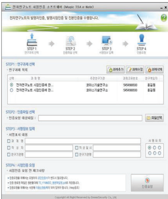
제품 메인 화면